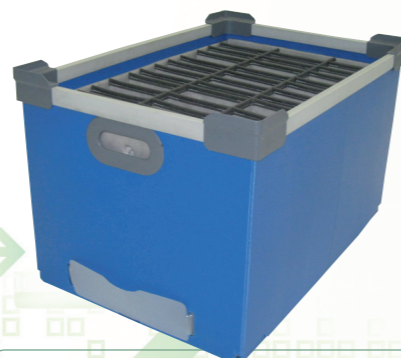
Bac & aménagement spécifique