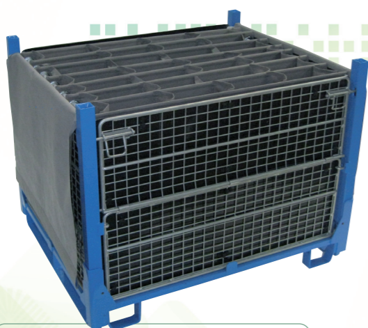
Calages souples ou rigides grands contenants