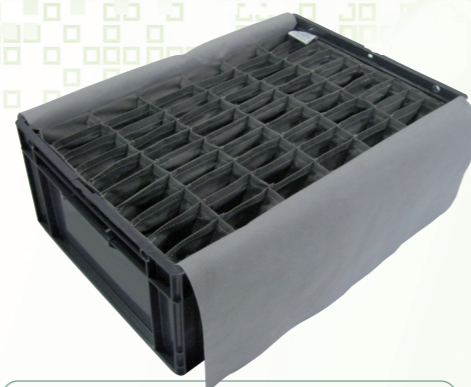
Calages souples ou rigides petits contenants

Retrouvez en détail tous nos produits sur www.ecopal.com