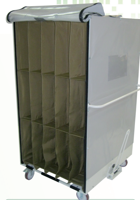
Chariot avec embase roulante