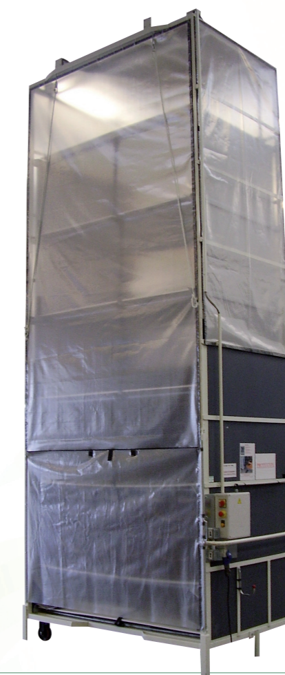
Stockeur vertical dynamique