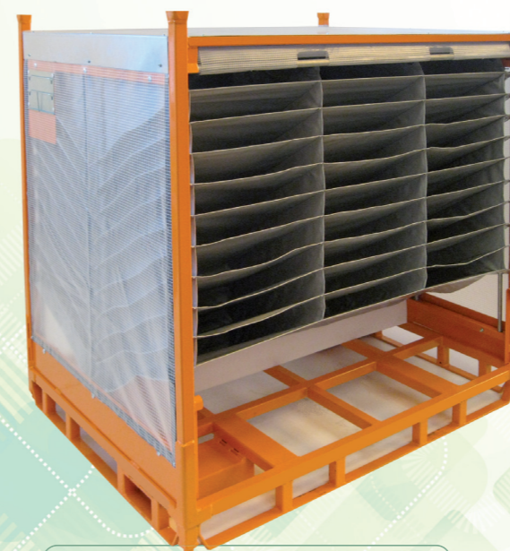
Conteneurs métalliques avec calage souple

Retrouvez en détail tous nos produits sur www.ecopal.com