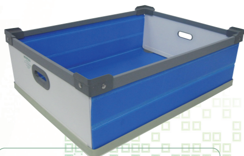
Bac repliable / Z-Box