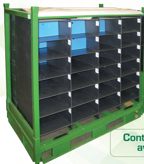
Conteneurs métalliques avec calage rigide